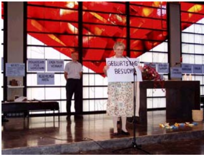
Aktivitäten der Pfarre

Das 40-jährige Pfarrjubiläum wurde im September mit mehreren Veranstaltungen gefeiert. Am 10. September gab es einen Dankgottesdienst, bei dem durch eine Bildpräsentation die Geschichte unserer Pfarre gezeigt wurde.